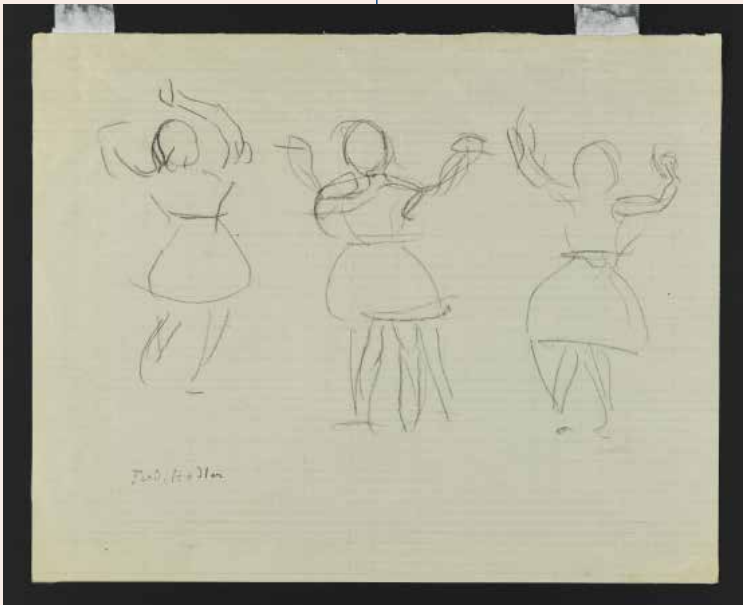
Ferdinand Hodler, "Paulette dansant", 1918. Crayon au graphite sur papier.

Force est de constater qu'aujourd'hui, grâce au travail de nombreux écrivains et historiens de l'art, Ferdinand Hodler est enfin réhabilité et reconnu pour son génie artistique, son intelligence et sa sensibilité.