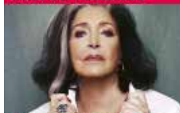
Françoise Fabian chanson me 12 décembre