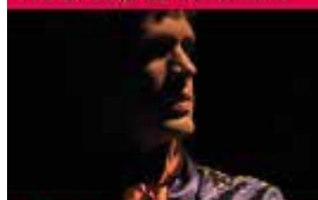
Le Porteur d'Histoire récital me 4 décembre