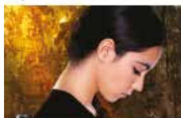
Mon Ange théâtre me 14 et je 15 novembre