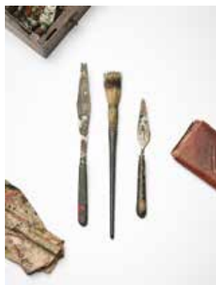
Pinceau, couteaux à peindre, boîte à couteaux et étui à cigares de Ferdinand Hodler.

C'était quelqu'un de vraiment passionné voire monomaniacal, comme moi, c'est ce qui m'a fait le plus plaisir lorsque je l'ai rencontré. Il a décidé très tôt de consacrer sa vie à l'étude de l'œuvre de Hodler à une époque où peu de gens s'y intéressaient. Il a rencontré ses descendants, certains de ses amis et a cherché toute sa vie à recueillir tout ce qu'il pouvait sur lui, que ça le touche de près ou de loin. Ce fut un véritable travail d'acharné. C'est pour cela que la collection est à la fois composée d'objets anecdotiques comme des quittances ou sa canne et de pièces fondamentales comme des textes autographes issus de sa correspondance avec ses enfants, ses amantes... Puis il a mis en place des expositions, des livres, qui ont permis de faire réévaluer l'œuvre de Hodler, son travail. Deux expositions ont été essentielles à sa réhabilitation et ont contribué à lui redonner une place dans le monde de l'art. La première sur le cycle de peinture concernant Valentine malade, mourante et morte car personne n'avait