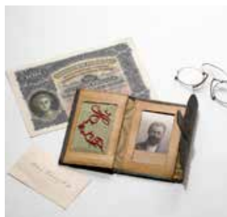
Porte-monnaie de Ferdinand Hodler brodé à ses initiales, avec lorgnon, photographie et billet de 100 francs, début du 20 e siècle. Cuir et doublure en soie.

Cette exposition marque la première étape d'une volonté des archives de devenir publiques. Avant aujourd'hui elles n'ont jamais été accessibles. Nous sommes donc en plein travail d'inventaire et de numérisation afin de faire connaître Hodler. Pour cette raison, sa correspondance est également en cours de publication. Il nous fallait donc franchir le pas et initier une réflexion sur le meilleur moyen de faire valoir la qualité de son œuvre. La Fondation Bodmer nous a semblé être le lieu idéal pour raconter l'homme et l'artiste à travers des objets et des manuscrits et faire rayonner son travail à Genève, en Suisse et à l'étranger. Pour ce faire, nous avons opté pour un itinéraire libre, il n'y a pas de chronologie à suivre, pas d'ordre particulier à respecter. Un plan pour se retrouver existe, mais c'est une proposition de parcours car ce sont des vitrines dans lesquelles se retrouvent des thématiques indépendantes les unes des autres. Nous avons surtout cherché à dresser un portrait en mosaïque de l'homme et de l'artiste.