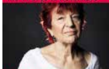
Anne Sylvestre chanson me 21 et je 22 novembre