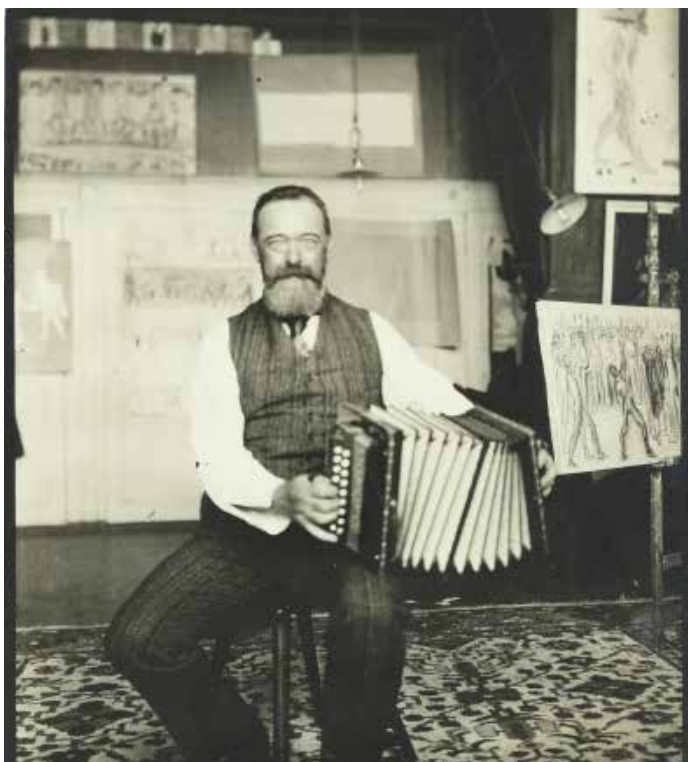
Emil Orlik, "Ferdinand Hodler assis dans son atelier jouant de l'accordéon", 1911.