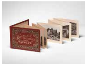
Imagier de l'Exposition nationale suisse de 1896. Leporello de 12 vues imprimées, 11,5 x 16,5 cm.

Les fleurons des Archives Jura Brüscheweiler, à savoir une centaine de documents inédits, exposés à la Fondation Bodmer mettent donc en lumière le parcours atypique de celui qui est actuellement considéré comme le plus grand peintre moderniste suisse et, dans le même temps, dévoilent plusieurs de ses facettes méconnues du public. À travers des photographies, des esquisses, des lettres et des objets ayant appartenu au peintre on découvre un homme intéressé par la musique, l'Égypte et la Grèce antiques, la littérature, la poésie... Sont donc mis en évidence ses liens étroits avec l'art sous toutes ses formes mais également des