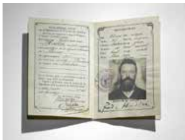
Passeport de Ferdinand Hodler, 1915.