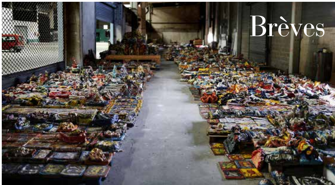
Oeuvre de Danielle Jacqui.