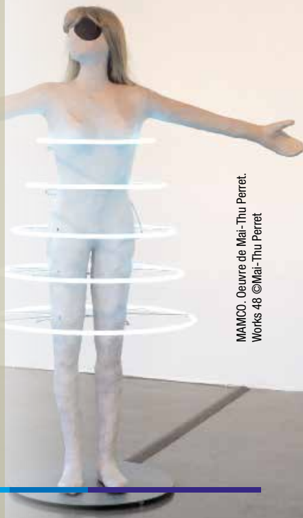
MAMCO. Œuvre de Mai-Thu Perret. Works 48 © Mai-Thu Perret