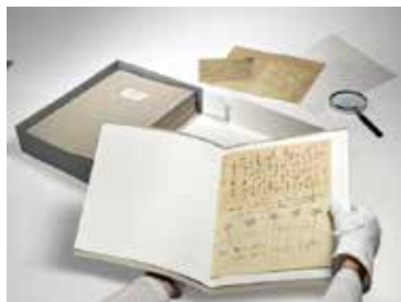
Conditionnement d'une lettre de Ferdinand Hodler pendant la campagne d'inventaire des Archives Jura Brüscheweiler.