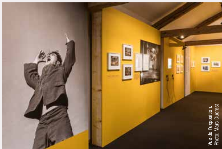
Vue de l'exposition.