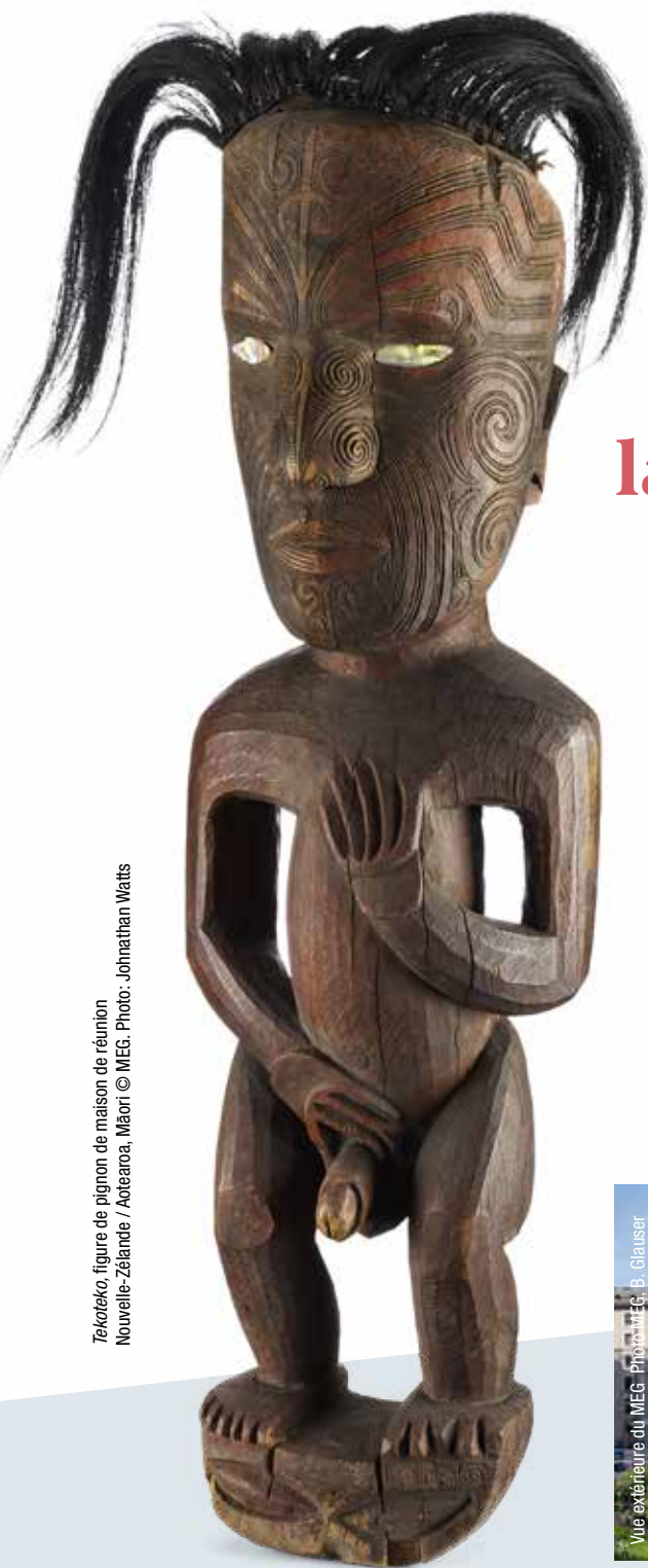
Tekoteko, figure de pignon de maison de réunion Nouvelle-Zélande / Aotearoa, Māori