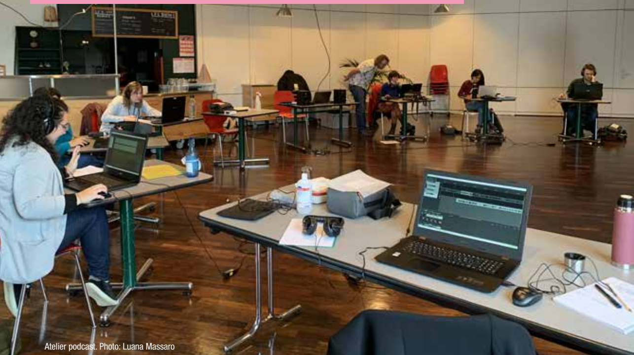
Atelier podcast.