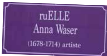
Affiche collée à la Rue de Lausanne lors de la Grève des Femmes le 14 juin 2019, impression laser

Celles et ceux qui attendent du musée la conservation et la classification figée et univoque d'un patrimoine matériel aux interprétations immuables seront sans doute déçu-e-s. Mais le musée ne se doit-il pas d'interpeller son public afin de le rendre acteur plutôt que spectateur dans la création d'un patrimoine historique commun dans lequel toutes et tous pourront se reconnaître?