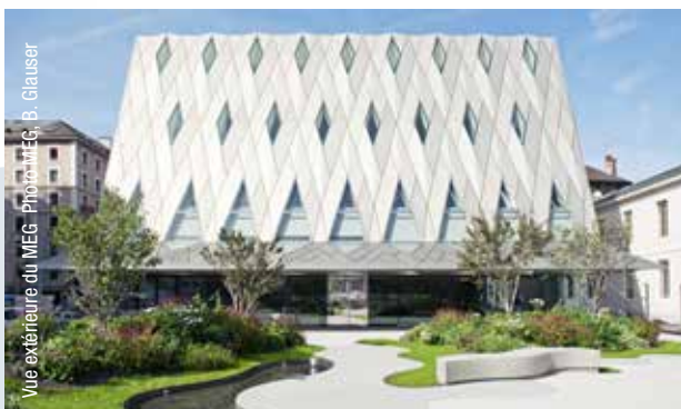
Vue extérieure du MEG.