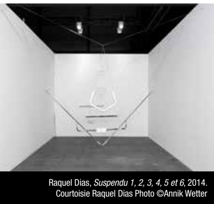
Raquel Dias, Suspendu 1, 2, 3, 4, 5 et 6 , 2014. Courtoisie Raquel Dias Photo ©Annik Wetter

Denis Savary, Corrima , 2021. Courtoisie Denis Savary