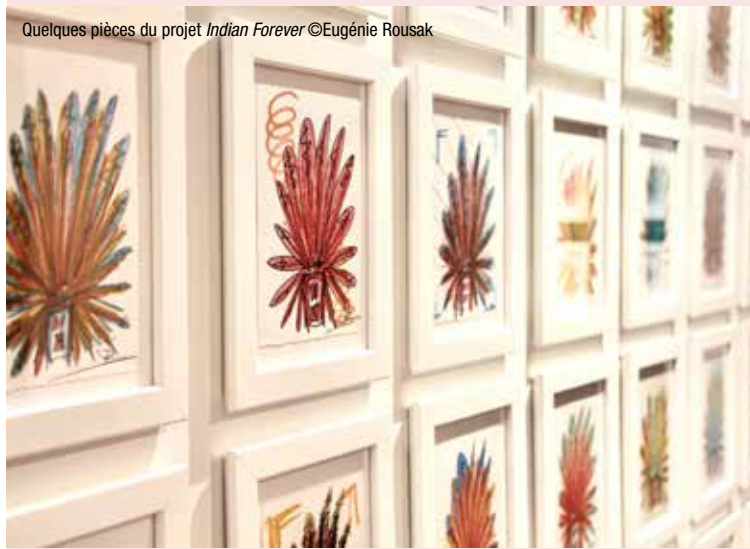
Quelques pièces du projet Indian Forever

En tout, ce travail a nécessité près de 3 ans, bien que je ne suivais aucun planning. Certains matins je réalisais deux-trois