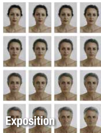
Série La Folie à deux , © LawrickMüller