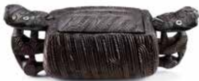
Waka huia , boîte à trésors. Nouvelle-Zélande / Aotearoa, Māori

Du point de vue du travail dans le musée, il est question de politique de représentation des autres cultures, de provenance, de restitution, d'appropriation culturelle, ... des questions sur lesquelles les revues spécialisées citent régulièrement les auteurs d'il y a trente ans. Les générations présentes actuellement dans le monde scientifique sont des générations qui ont pris le soin de faire un vrai terrain, de travailler avec les populations concernées et de leur donner une voix.