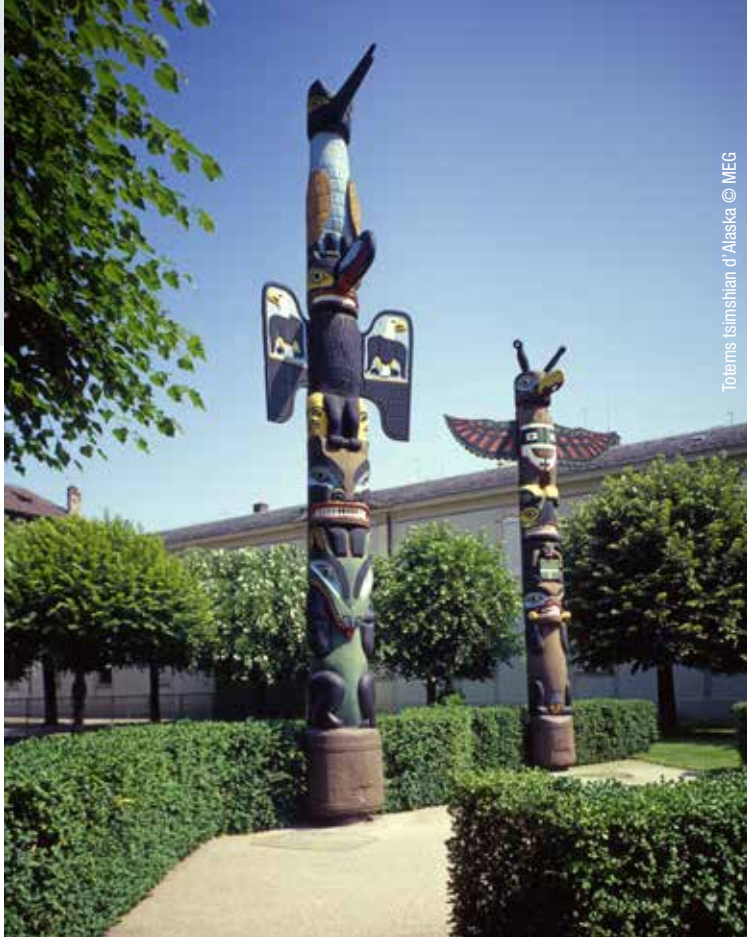
Totems tsimshian d'Alaska © MEG

Ce n'est donc pas qu'on ne l'avait jamais fait auparavant... mais c'était parfois très long. Aujourd'hui avec le numérique ça devient d'autant plus facile, et toutes les conservatrices et conservateurs travaillent sur ces cas. En ce moment par exemple, on avance sur la question des restes humains d'origine aborigènes. Ça fait 20 ans que la conservatrice échange des courriers, mais aujourd'hui il y a des nouvelles institutions en Australie, de l'aide à la recherche; nous nous attendons à une évolution dans ce domaine-là.