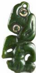
Hei tiki , pendentif de cou. Nouvelle-Zélande / Aotearoa, Māori