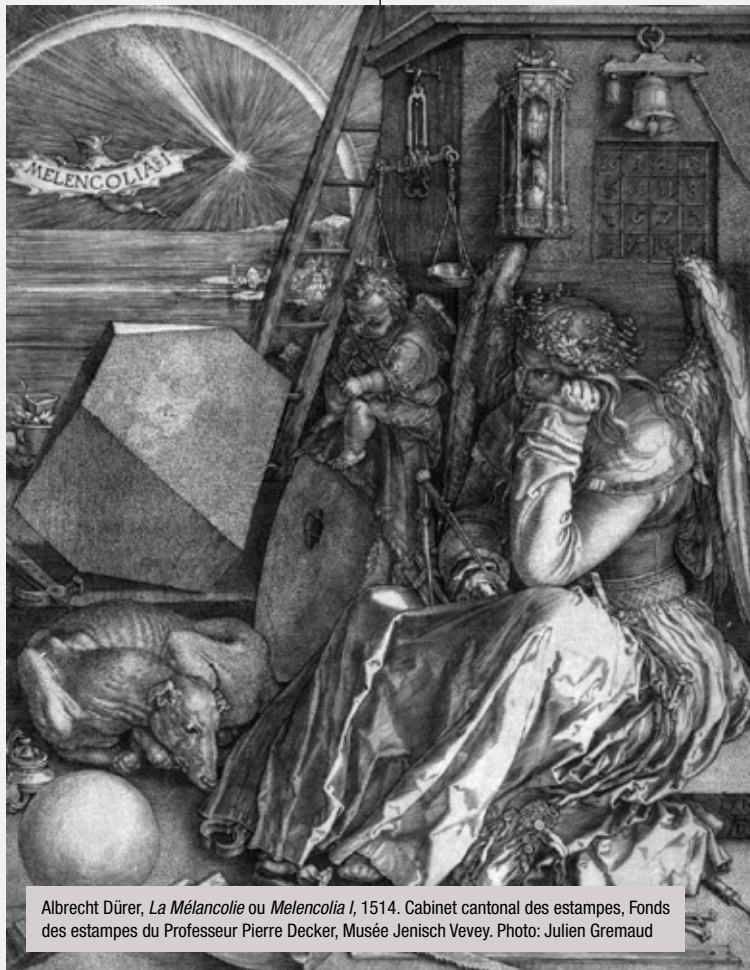
Albrecht Dürer, La Mélancolie ou Melencolia I , 1514. Cabinet cantonal des estampes, Fonds des estampes du Professeur Pierre Decker, Musée Jenisch Vevey.