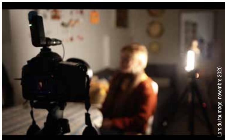
Lois du tournage, novembre 2020

Invisible déjà: le travail domestique dans l'espace privé, assumé en immense majorité par des femmes. Plus invisible encore: les femmes immigrées sans autorisation de séjour, employées par des particuliers pour s'acquitter de ces tâches. Ménages, gardes d'enfants, soins aux personnes âgées ou dépendantes... Elles sont des milliers à Genève, pour beaucoup originaires d'Amérique latine, vivant et travaillant dans une précarité financière et humaine considérable: salaires parfois dérisoires, pas de cotisation aux assurances sociales, crainte permanente d'un contrôle et d'un renvoi, isolement... Et pourtant, elles subviennent à leurs besoins et à