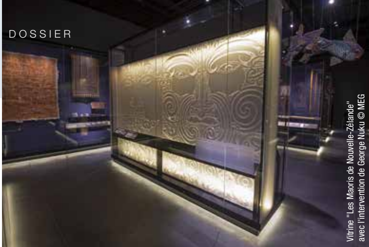
Vitrine "Les Maoris de Nouvelle-Zélande" avec l'intervention de George Nuku