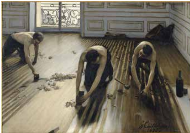
Gustave Caillebotte, Les raboteurs de parquet , 1875. Paris, musée d'Orsay, don des héritiers de Gustave Caillebotte par l'intermédiaire d'Auguste Renoir, son exécuteur

ceux brossés dans sa propriété familiale de Yerres. Ils se distinguent beaucoup des mouvements précédents, comme les paysages forestiers de l'École de Barbizon ou de la peinture naturaliste de Gustave Courbet, son grand aîné. Gustave Caillebotte se concentre surtout sur les miroirs d'eau et les extraordinaires subtilités de leurs reflets, entre perspective et "profondeur" précise Daniel Marchesseau.