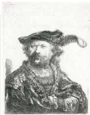
Rembrandt van Rijn, Rembrandt au bonnet orné d'une plume , 1638. Cabinet cantonal des estampes, Collection du Musée Alexis Forel.