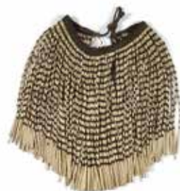
Piupiu , jupe. Nouvelle-Zélande / Aotearoa, Māori