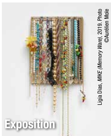
Ligia Dias, MIKE (Memory Ware) , 2019.