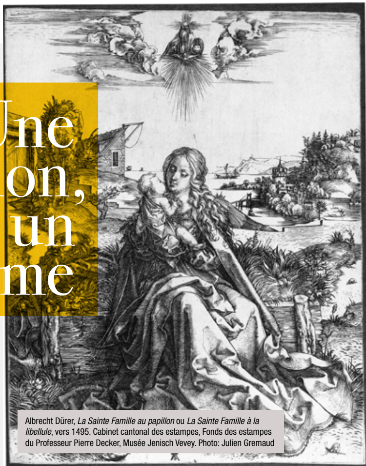
Albrecht Dürer, La Sainte Famille au papillon ou La Sainte Famille à la libellule , vers 1495. Cabinet cantonal des estampes, Fonds des estampes du Professeur Pierre Decker, Musée Jenisch Vevey.

Une estampe, ça se regarde de près. Parce que le format nous y invite, bien sûr, mais surtout parce que ça s'apprivoise. Traits, noir et blanc, clair-obscur définissent ce monde nouveau, cette technique particulière. D'abord gravée sur une plaque de bois, de métal ou de pierre, c'est seulement dans un second temps que l'image apparaît sur le papier, révélant ainsi toute la finesse du travail de l'artiste. L'originale peut ensuite être retravaillée et reproduite en plusieurs exemplaires, chaque "épreuve" devenant à la fois une copie de la précédente et une œuvre originale.