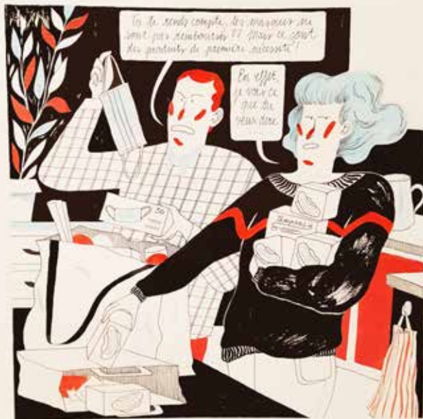
Besoin et nécessité, 2021. Laurence Pernet – Collection de l'artiste.

www.lausanne.ch/vie-pratique/culture/musees/mhl