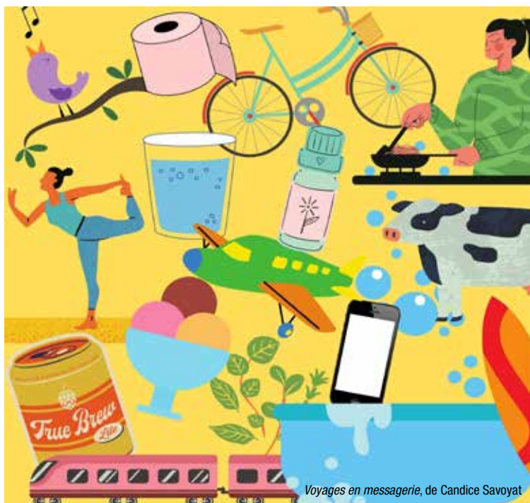
Voyages en messagerie, de Candice Savoyat