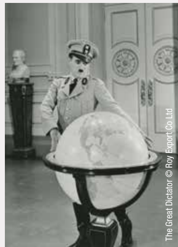
The Great Dictator

Pour les plus jeunes, le studio offre comme toujours un ravissant parcours interactif, qui emmène son public à travers