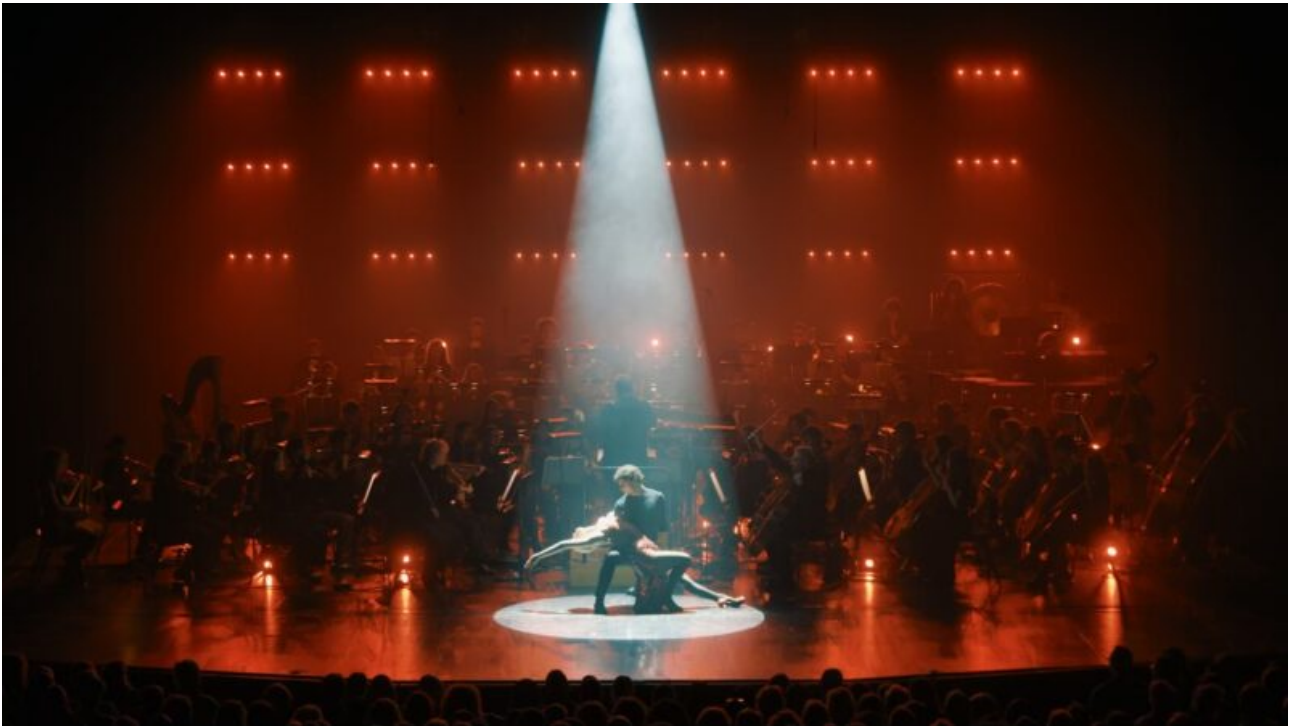
Young Broadway.